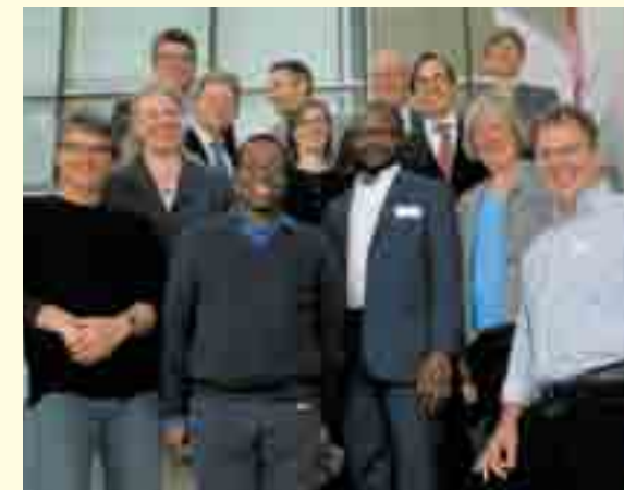
Mitglieder des REZ an der Landeskonferenz 2017